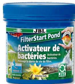
JBL FilterStart Pond Activateur de bactéries pour filtre de bassin