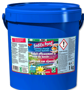
JBL SediEX Pond Bactéries et oxygène actif pour dégrader les boues