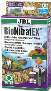
JBL BioNitratEx Matériel biofiltrant pour éliminer les nitrates