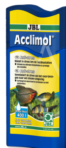
JBL Acclimol Wasseraufbereiter zur Neueingewöhnung