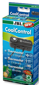
JBL CoolControl Thermostat de commande pour refroidisseurs