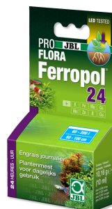
JBL PROFLORA Ferropol 24 Dagelijkse bemesting voor zoetwateraquaria