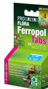
JBL PROFLORA Ferropol Tabs Plantenmest voor zoetwateraquaria