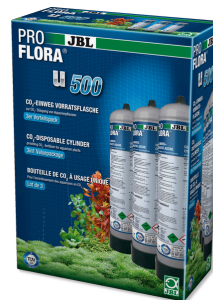
JBL PROFLORA 3 x u500 CO 2 -wegwerp voorraadfles