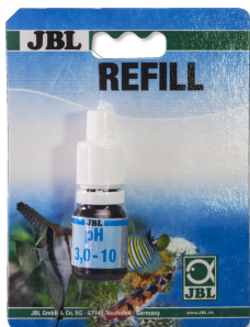
JBL pH 3,0-10,0 test Sneltest voor het bepalen van het zuurgetal