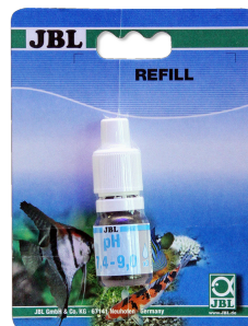
JBL pH 7,4-9,0 test pH test voor aquaria en vijvers voor 7,4-9,0