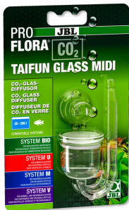
JBL PROFLORA CO2 TAIFUN GLASS Diffuseur de CO2 en verre pour aquarium de 40 à 300 l