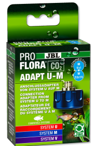
JBL PROFLORA CO2 ADAPT U - M CO2 Umrüstungs-Adapter von Einweg- auf Mehrwegflaschen