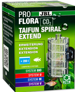
JBL PROFLORA CO2 TAIFUN SPIRAL EXTEND Erweiterung für JBL PROFLORA CO2 TAIFUN SPIRAL 5 / 10