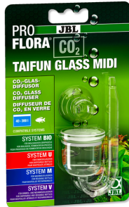
JBL PROFLORA CO2 TAIFUN GLASS Glas-CO2-Diffusor für Süßwasseraquarien von 40-300 l