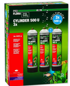
JBL PROFLORA CO2 CYLINDER 500 U 3x 500 g CO2-Einweg-Vorratsflasche (3er Vorteils-Pack)