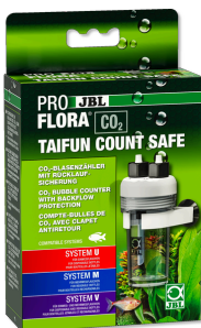
JBL PROFLORA CO2 TAIFUN COUNT SAFE CO2-Blasenzähler mit eingebauter Rückflusicherung