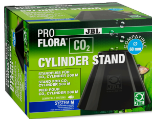
JBL PROFLORA CO2 CYLINDER STAND Standfuß für 500 g CO2 Flaschen