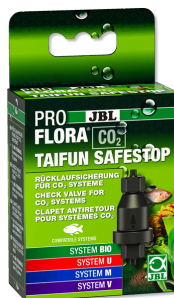
JBL PROFLORA CO2 TAIFUN SAFESTOP Wasserrückflusicherung für CO2-Anlagen