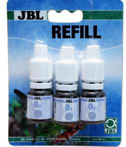
JBL O 2 oksijen testi New Formula (yeni formül)

Oksijen içeriğini saptamaya yönelik hızlı test