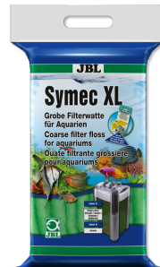
JBL Symec XL Filtre yünü Her türlü su bulanıklığına karşı kaba akv. filt. pam.