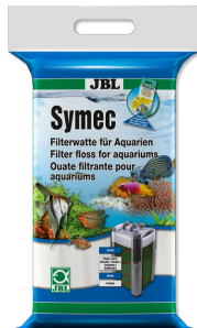
JBL Symec Tüm su bulanıklıklarına karşı filtre pamuğu