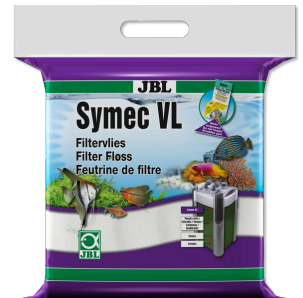
JBL Symec VL Her türlü su bulanıkl. karşı akv. filt.-pamuğu geçesi