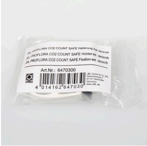
JBL PF CO2 COUNT SAFE askı seti