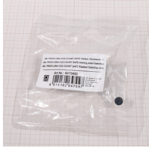
JBL PF CO2 COUNT SAFE tesp. plakası+geri ak. önl.