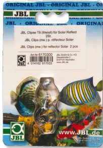
JBL Clips T5/T8 metal Soporte de metal para tubos fluorescentes