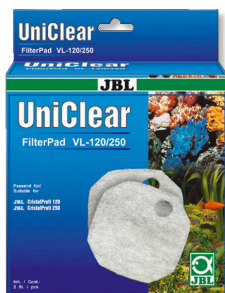
JBL FilterPad VL Velo de algodão para filtros de aquário CristalProfi