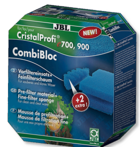
JBL CombiBloc CristalProfi e Cartuchos pré-filtrantes e espuma para CristalProfi e