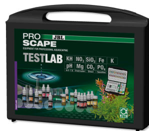
JBL PROAQUATEST LAB PROSCAPE Mala de teste p/ análise à água em aquários de plantas