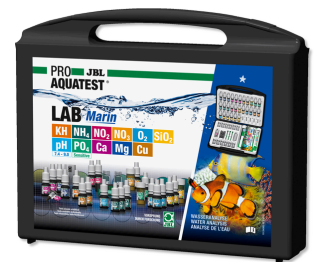
JBL PROAQUATEST LAB Marin Mala de teste profissional p/ análise de água salgada