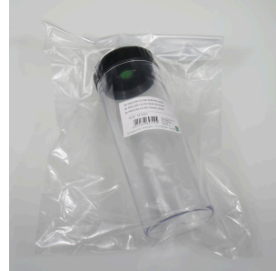
PROFLORA CO2 BIO REAKTOR