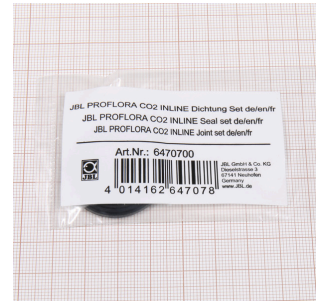
JBL PF CO2 INLINE Kit de vedação