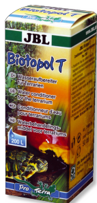
JBL Biotopol 7 Кондиционер для террариумов