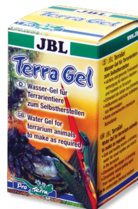
JBL TerraGel Водный гель для террариумных животных

Препарат для ухода за панцирем сухопутных черепах