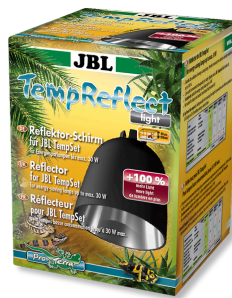
JBL TempReflect light Рефлектор для энергосберегающих ламп