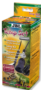
JBL TempSet connect Комплект для установки с разъёмным соединением