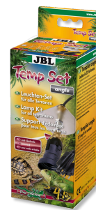
JBL TempSet angle Комплект для установки ламп в террариуме