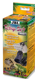
JBL TempSet basic Комплект для установки ламп в террариуме