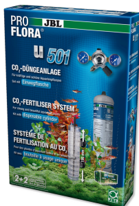
JBL PROFLORA u501 CO2-система для удобрения растений, полный комплект