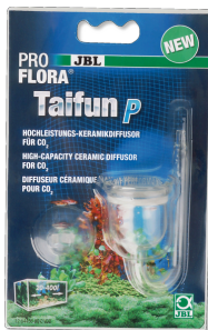
JBL ProFlora Taifun P Миниатюрный CO2-диффузор для пресноводных аквариумов