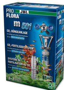
JBL PROFLORA m501 CO2-система для аквариумных растений, полный комплект