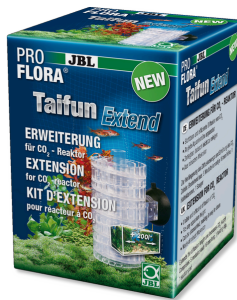
JBL PROFLORA Taifun Extend Модуль расширения диффузионного CO2-реактора