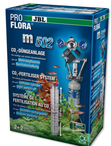
JBL PROFLORA m502 CO2-система с отключением на ночь