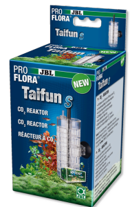
JBL PROFLORA Taifun S Расширяемый CO2-диффузор для миниатюрных аквариумов