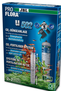
JBL PROFLORA u502 CO2-система с ЭМ клапаном