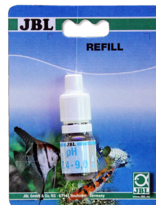
JBL Test pH 7,4-9,0 Test pH 7,4-9,0 pour aquariums et bassins