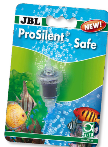
JBL ProSilent Safe Sécurité antiretour