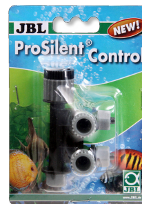
JBL ProSilent Control Robinet à air de précision réglable