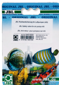
JBL Clapet anti-retour Sécurité antiretour pour pompe à air