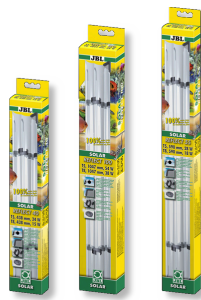
JBL SOLAR Reflect T5/ T8 (895-1500 mm) Réflecteur pour tube fluorescent SOLAR