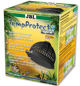
JBL TempProtect II light Protection antibrûlure pour reptiles pour JBL TempSet