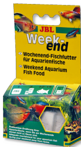
JBL Weekend Mangime weekend completo per tutti i pesci d'acquario