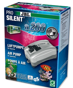
JBL PROSILENT a200 Pompa ad aria per acquari di acqua dolce e marina