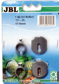
JBL SOLAR REFLECT Clip Set Halterung für Leuchtstoffröhren