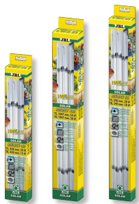
JBL SOLAR Reflect T5/ T8 - 895-1500 mm Reflektorblech für Solar- Leuchtstoffröhre