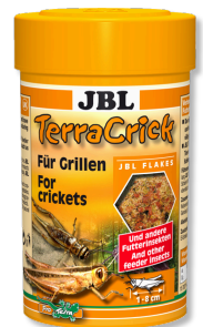
JBL TerraCrick Alleinfutter für Futterinsekten