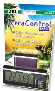
JBL TerraControl Solar Termometro e igrometro solari per tutti i terrari