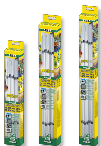
JBL SOLAR Reflect T5/ T8 - 895-1500 mm Pannello riflettore per tubo fluorescente Solar