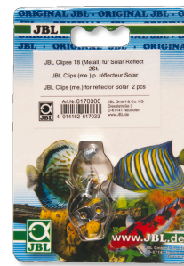
JBL Morsetti T5/T8 metallo Supporto di metallo per tubi fluorescenti