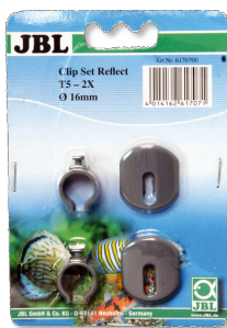
JBL SOLAR REFLECT set di clip Supporto per tubi fluorescenti