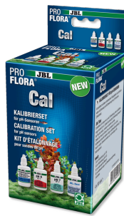
JBL PROFLORA Cal Komplettsset zur Kalibrierung