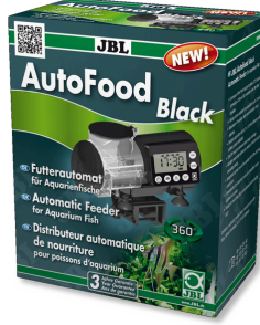
JBL AutoFood BLACK Akvaryum balıkları için siyah yem otomatı