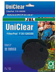
JBL FilterPad F35 CristalProfi akvaryum filtresi için ince sünger