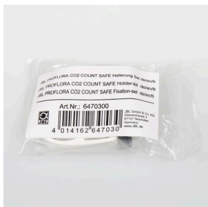
JBL PF CO2 COUNT SAFE sada držáků