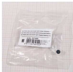
JBL PF CO2 COUNT SAFE mont. podl+poj.