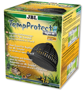
JBL TempProtect II light Reptilien- Verbrennungsschutz für JBL TempSets