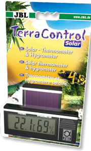
JBL TerraControl Solar Solar-Thermometer und Hygrometer für alle Terrarien