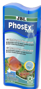
JBL PhosEx rapid Phosphatentferner für Süßwasser-Aquarien