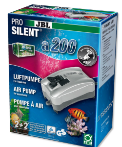
JBL PROSILENT a200 Luftpumpe für Süß- und Meerwasser-Aquarien