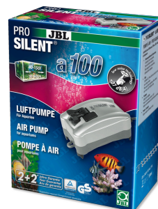
JBL PROSILENT a100 Luftpumpe für Süß- und Meerwasser-Aquarien