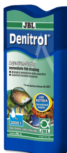
JBL Denitrol Bakterienstarter zum Einsatz von Aquarienfischen