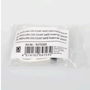
JBL PF CO2 COUNT SAFE Halterung Set