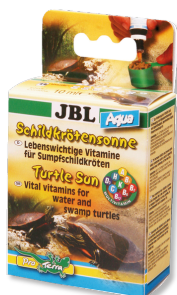
JBL Soleil Tropic Aqua

Vitamines pour tortues d'eau et de marais