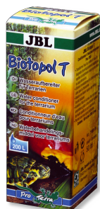
JBL Biotopol T

Vitamines pour tortues d'eau et de marais