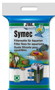
JBL Symec Ouate filtrante Ouate filtrante contre toute turbidité de l'eau