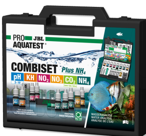
JBL PROAQUATEST COMBISET Plus NH 4 Coffret avec les principaux tests d'eau + test NH 4