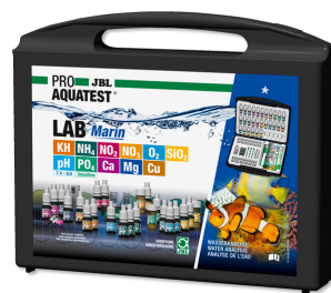
JBL PROAQUATEST LAB Marin Coffret professionnel d'analyse de l'eau de mer