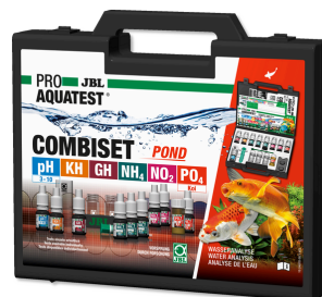
JBL PROAQUATEST COMBISET POND Maletín para analizar agua en estanque de kois/jardín