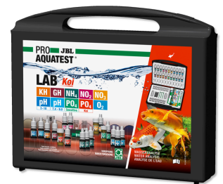
JBL PROAQUATEST LAB Koi Maletín de tests profes. p. estanques de kois/jardín