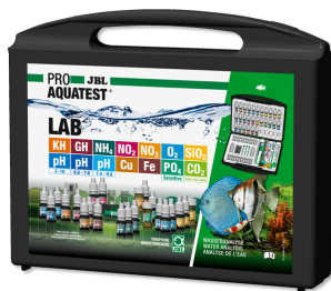
JBL PROAQUATEST LAB Maletín con 13 test para analizar el agua dulce