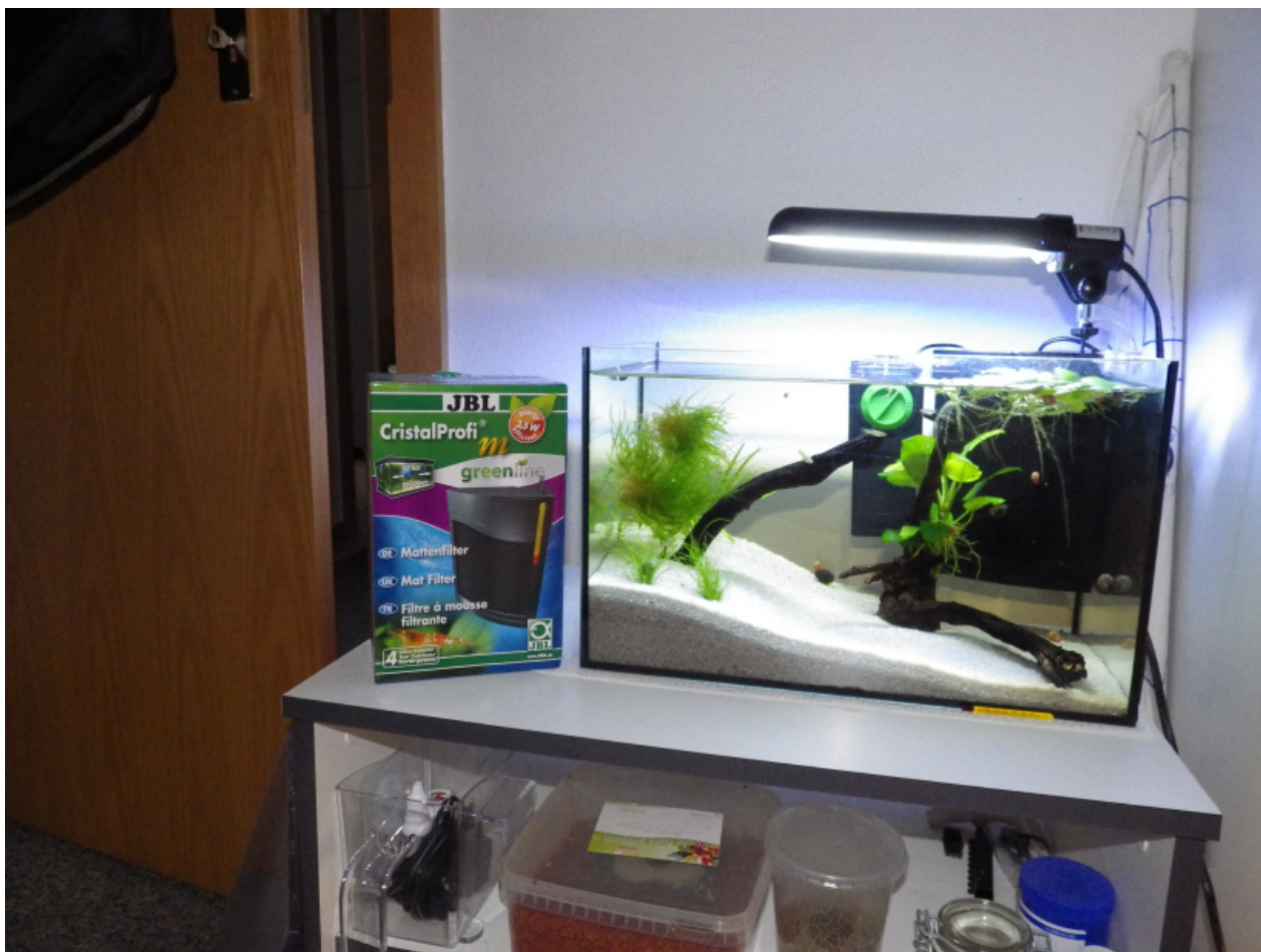
Der Filter, seine Verpackung und sein neues Zuhause