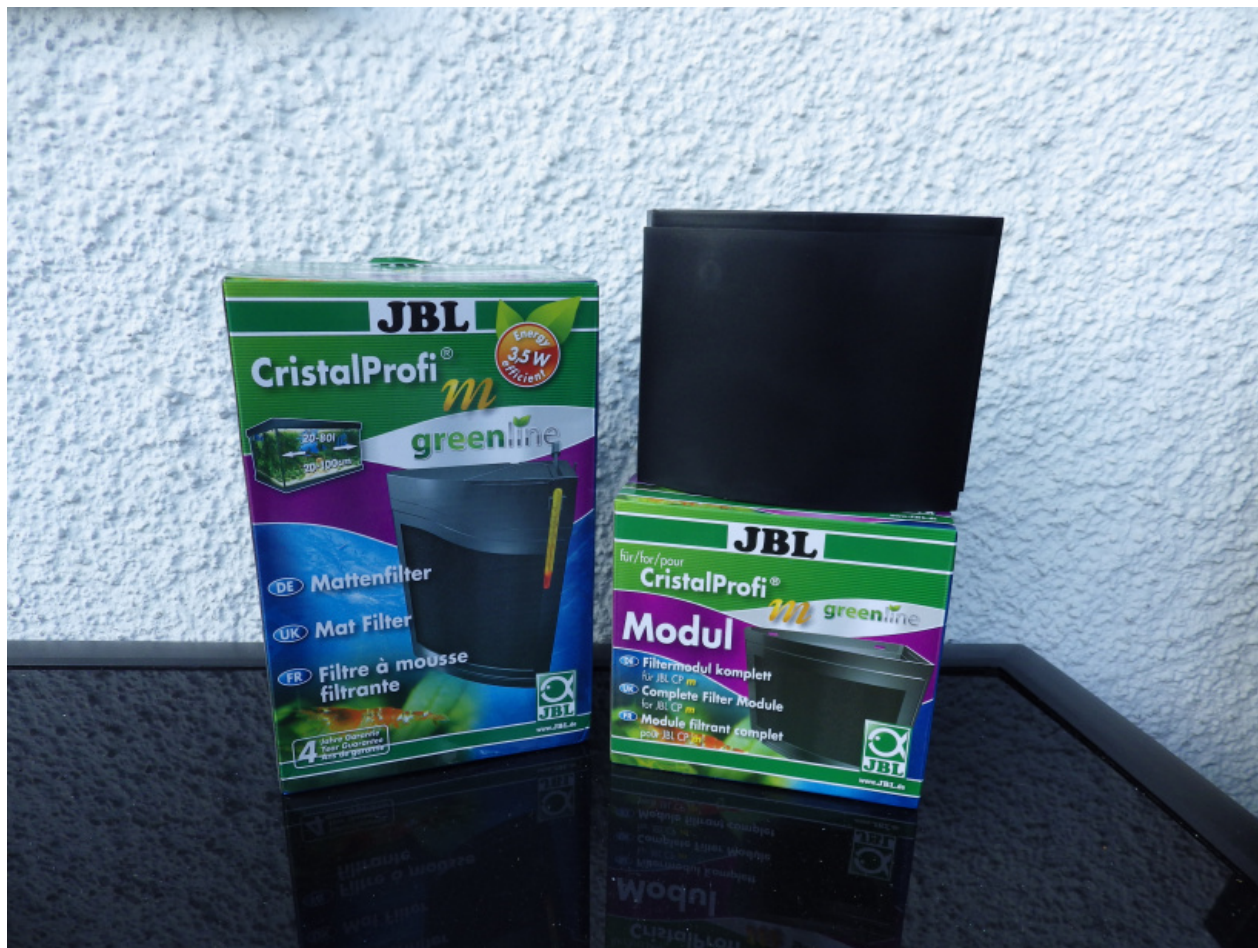
Der Filter mit Zusatzmodul

Mal wieder ist einige Zeit seit dem letzten Produkt, das ich vorstellte vergangen, aber ich möchte nur Produkte vorstellen, die meine und eventuell auch die Begeisterung meiner Leser wecken und so kam es, dass eines herrlichen morgens der Postbote vor der Tür stand und mir diesen Mattenfilter reichte und ich diesen blitzschnell ergriff um ihn zu installieren.