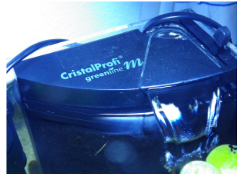
Der Filter im Betrieb.. Er erzeugt einen sehr schönen und gleichmäßigen Ausfluss

Wer sich für den Kauf dieses Filters entscheidet, bekommt nicht nur das styl ische Komplettpaket sondern auch einen leistungsstarken Filter, welcher bis zu 200 l/h an Leistung erbringt. Dieser Filter ist laut Hersteller auch für die mechanische und biologische Langzeit-Filterung ausgelegt und dies mit einem Stromverbrauch von unglaublichen 3,5 Watt, was ihn zu einem totalen Stromsparer macht und somit auch interessant für viele Aquarianer. Auf Grund der großen Filtermatte, die vorne am Filter sitzt, haben Jungfische und Garnelen eine enorm große Fläche, von welcher sie Mikroorganismen und Aufwuchs abweiden können (Ich denke, dass dies auch für Schnecken gilt). Zusätzlich wird ein Mini-Thermometer mitgeliefert, welches man direkt am Filter anbringen kann. Da dieser Filter recht schmal gebaut wurde, kann er perfekt im Aquarium angebracht werden und ist mit einer Höhe von 19 cm, einer Breite von 6,5 cm (beim Saugnapf, am vorderen Ende ist er ca. 1,4 cm breit) und einer Länge von 12,8 cm meines Erachtens fast für jedes Becken geeignet. Die Befestigung des Filters wird mittels eines arretierbaren Saughalters geregelt, somit löst sich das Problem des ewigen Saugnapfes, der sich nicht von der Scheibe lösen will.