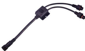
JBL LED SOLAR - Câble de connexion en Y