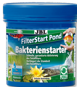
JBL FilterStart Pond Activateur de bactéries pour filtre de bassin