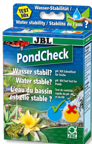
JBL PondCheck Test rapide pour la détermination du pH et du KH