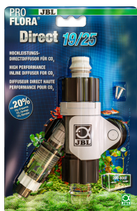
JBL PROFLORA Direct Diffusore diretto ad alto rendimento per la CO2