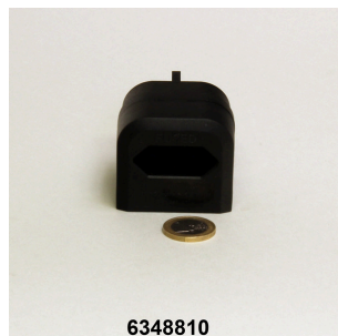
JBL Adattatore per tutte le prese elettriche inglesi piatte