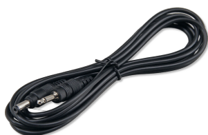
JBL pH-Control Touch cavo di collegamento