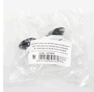
JBL PF CO2 INLINE крепление в компл.