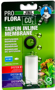
JBL PROFLORA CO2 TAIFUN INLINE MEMBRANE

Сменная мембрана для диффузора CO2 TAIFUN INLINE