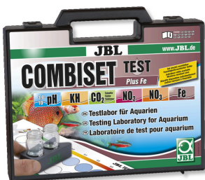
JBL Test Combi Set Plus Fe Testkoffer mit den wichtigsten Wassertests + Eisentest