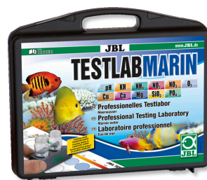
JBL Testlab Marin Professioneller Testkoffer zur Meerwasser-Analyse