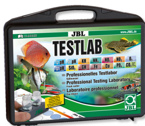
JBL Testlab Testkoffer mit 13 Tests zur Süßwasseranalyse Testlab