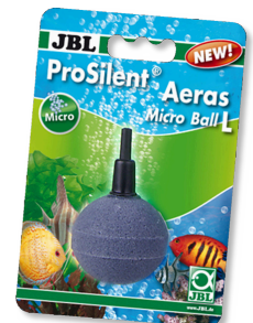
JBL ProSilent Aeras Micro Ball L Ausströmerstein für feine Luftblasen