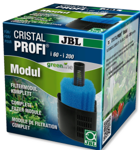
JBL CRISTALPROFI i greenline Modul Filtermodul für Innenfilter CristalProfi i Serie