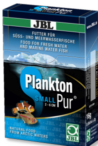
JBL PlanktonPur SMALL Leckerbissen für kleine Aquarienfische