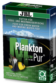
JBL PlanktonPur MEDIUM Leckerbissen für große Aquarienfische