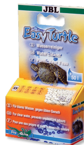
JBL Easy Turtle

Vitamines pour tortues d'eau et de marais